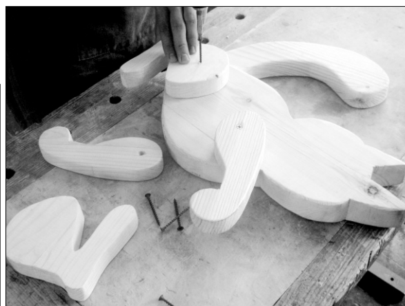
Прикрутить к туловищу лапы.