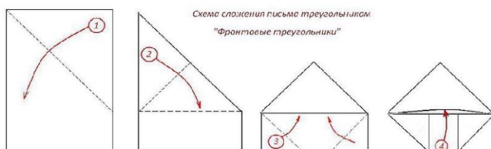
Схема сложения письма треугольником «Фронтные треугольники»